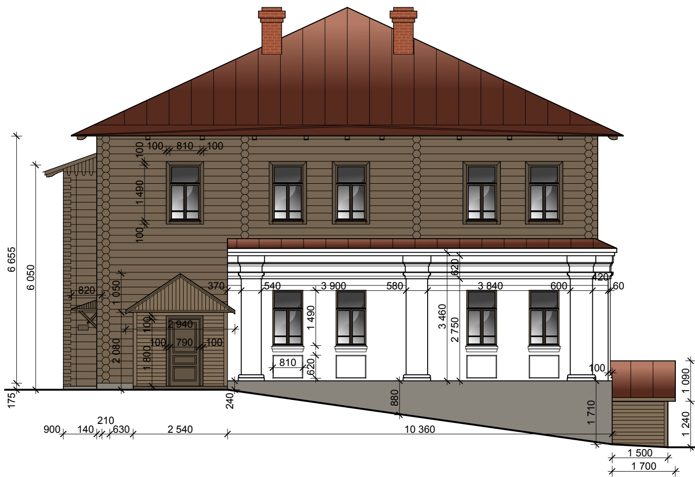
Западный фасад М 1:50