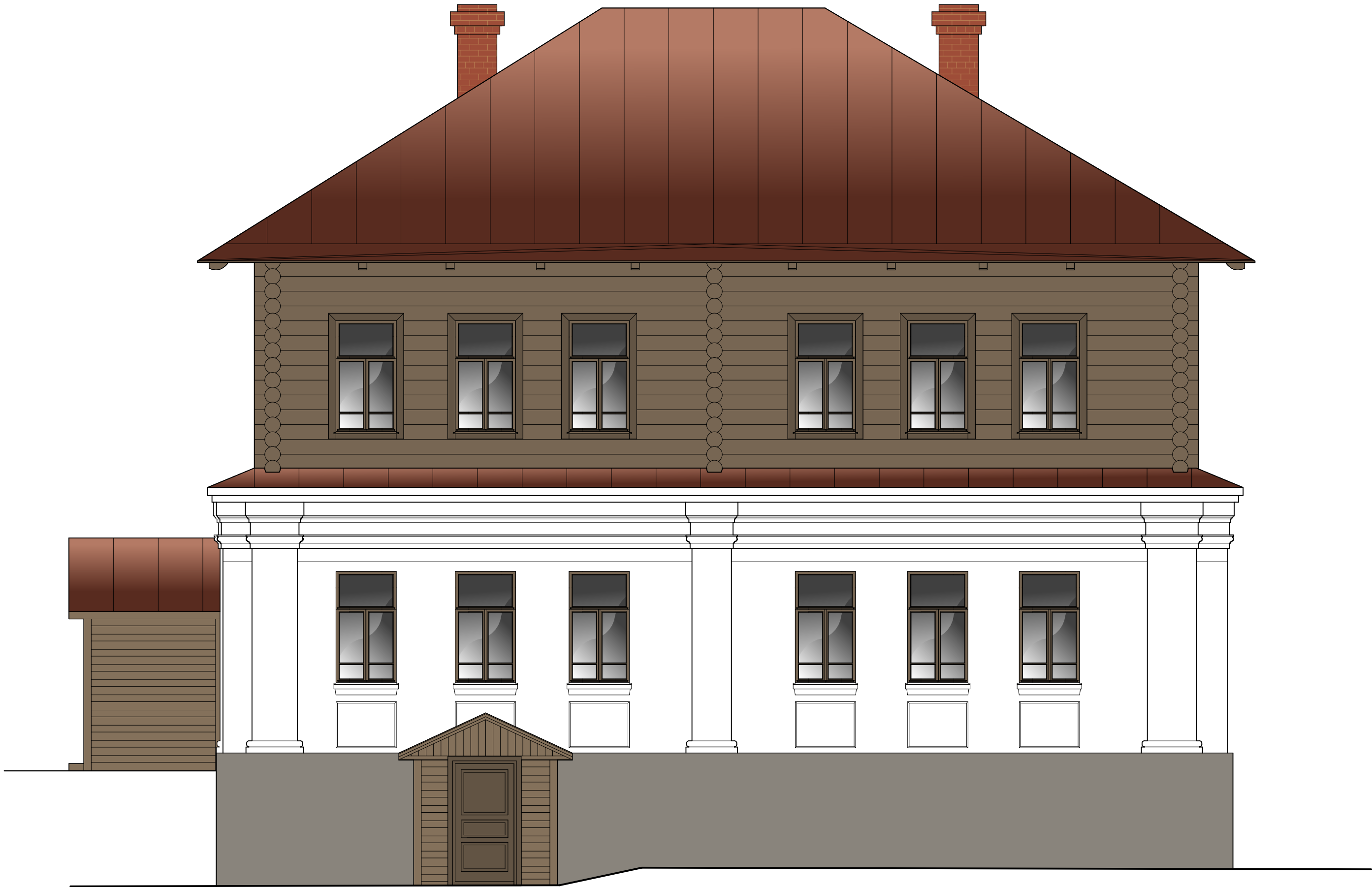
Южный фасад М 1:50